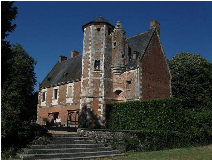
Замок Плесси ле Тур, где Жанна воспитывалась под наблюдением дяди, короля Франциска I

Двенадцатилетняя Жанна, встряхивая белокурыми локонами, весело играла с собачкой в охотничьем замке Плесси де Тур, когда послышался рожок, извещающий о прибытии в Амбуаз короля.