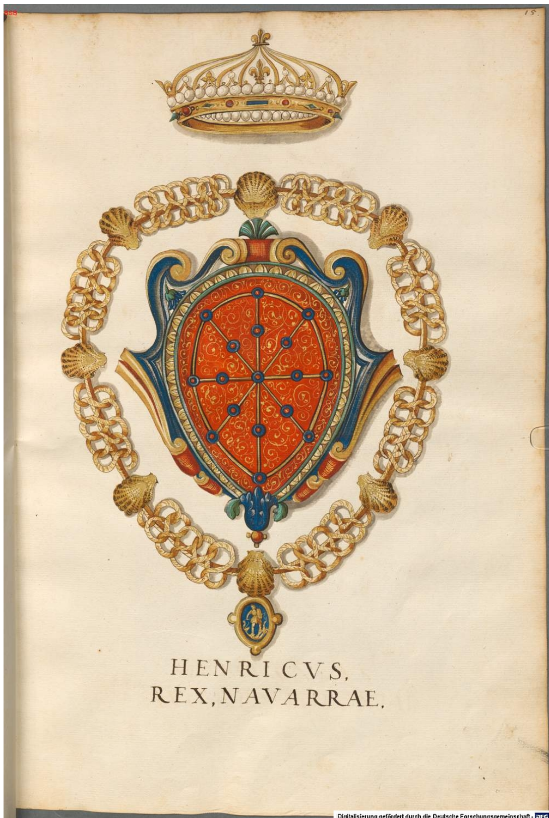
Герб короля Наварры

Digitalisierung gefördert durch die Deutsche Forschungsgemeinschaft · DFG