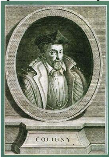
Лидер гугенотов адмирал Гаспар де Колиньи. Музей гугенотов в Бад Карлшафен, Германия

Собственно, этой начисто лишенной каких-либо принципов женщине, набожной христианке, с легкостью служившей черные мессы 4 , было глубоко наплевать и на католиков, и на протестантов. Значение имело лишь одно: чтобы у власти оставалась династия Валуа, а она, Екатерина Медичи, управляла страной. Во имя этой цели годились любые средства. «Одно время Бурбонам противостояли ревностные католики Гизы, по сути, управлявшие государством через свою племянницу Марию Стюарт 5 . Покойный король Франциск II спешил выполнить любую ее просьбу, - плавно текли мысли Мадам. - Теперь враждующие кланы поменялись ролями. Второй сын, Карл IX, тоже ускользает от моего влияния, попав под обаяние признанного главы протестантов Гаспара де Колиньи.