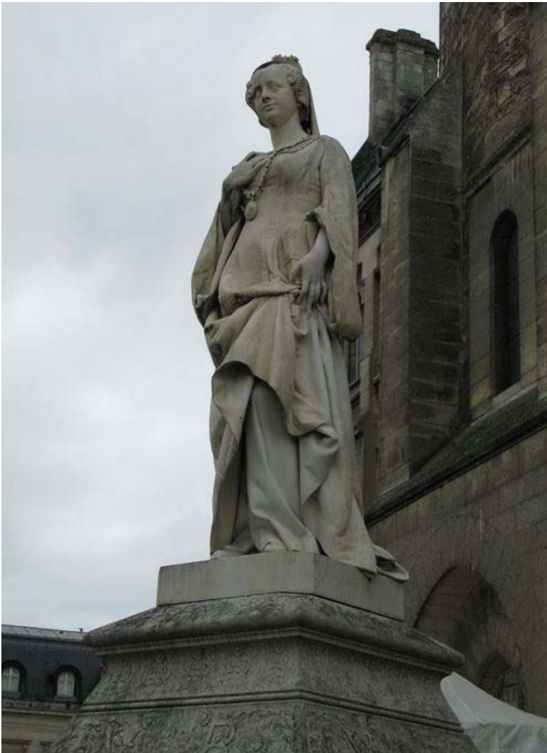
Статуя Маргарите Валуа в Ангулеме

Когда Франциска I взяли в плен, Маргарита немедленно отправилась в Испанию, чтобы ухаживать за тяжело заболевшим братом. Всесильный монарх платил ей той же монетой, во всем советуясь со своей утонченной, блестяще образованной сестрой, знавшей с добрый десяток европейских и древних языков. Во имя государственной политики обожаемого брата Маргарита пожертвовала своей личной жизнью, дважды выйдя замуж без любви. В первый раз – за герцога Ангулемского.