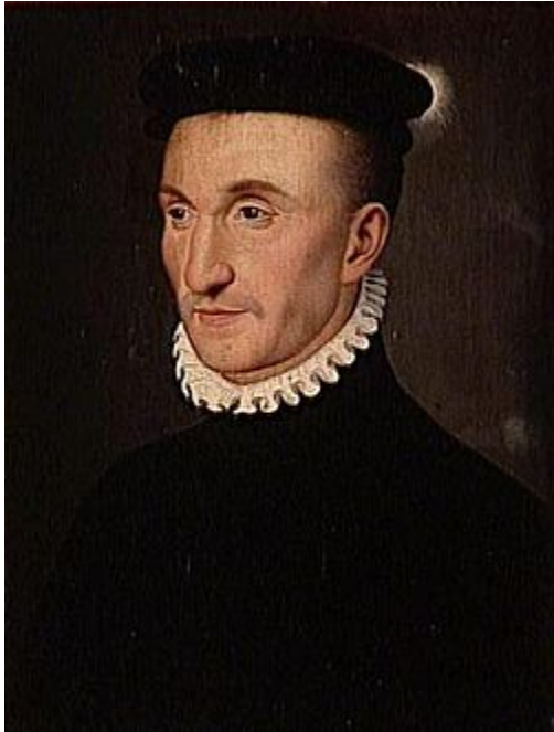
Генрих II д'Альбре 1 , король Наварры

Рачительный государь и отличный солдат, мужественный и подчас жестокий, вечно пахнувший луком, предоставил супруге полную свободу действий, довольствуясь прелестями сельских красоток.