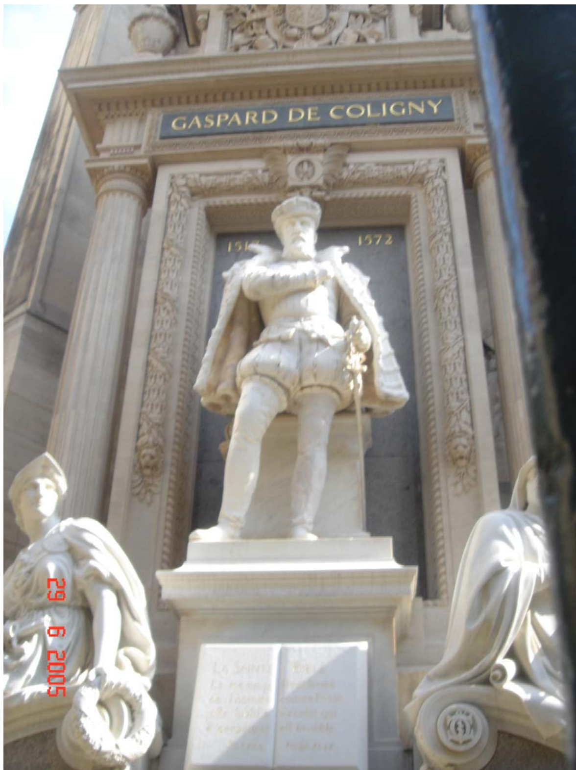
Статуя адмирала Гаспара де Колиньи, установленная в его дворце напротив Лувра