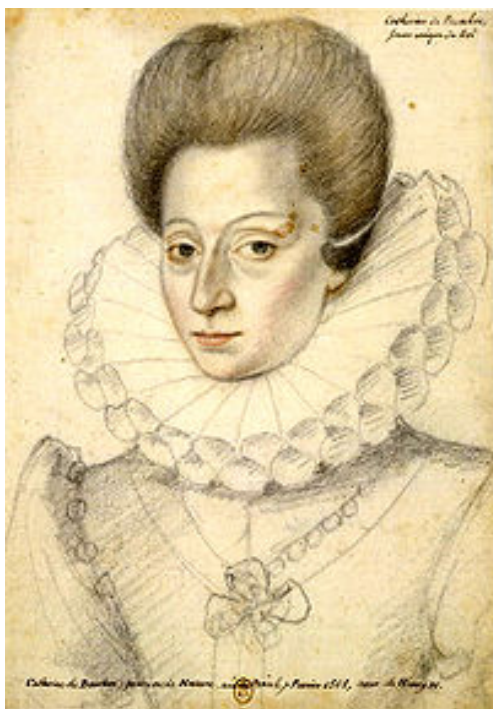
Екатерина де Бурбон – дочь королевы Наваррской

Из письма Екатерины Медичи Жанне Наваррской