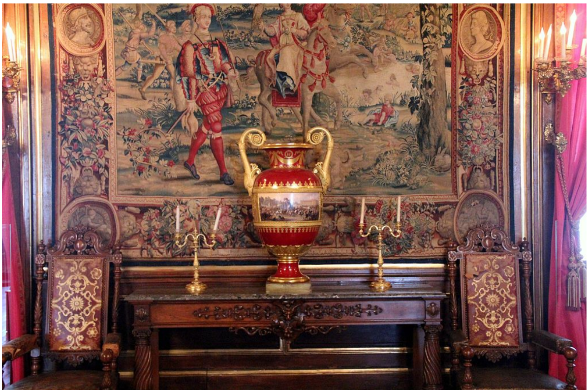
... и гобелен из знаменитой коллекции гобеленов