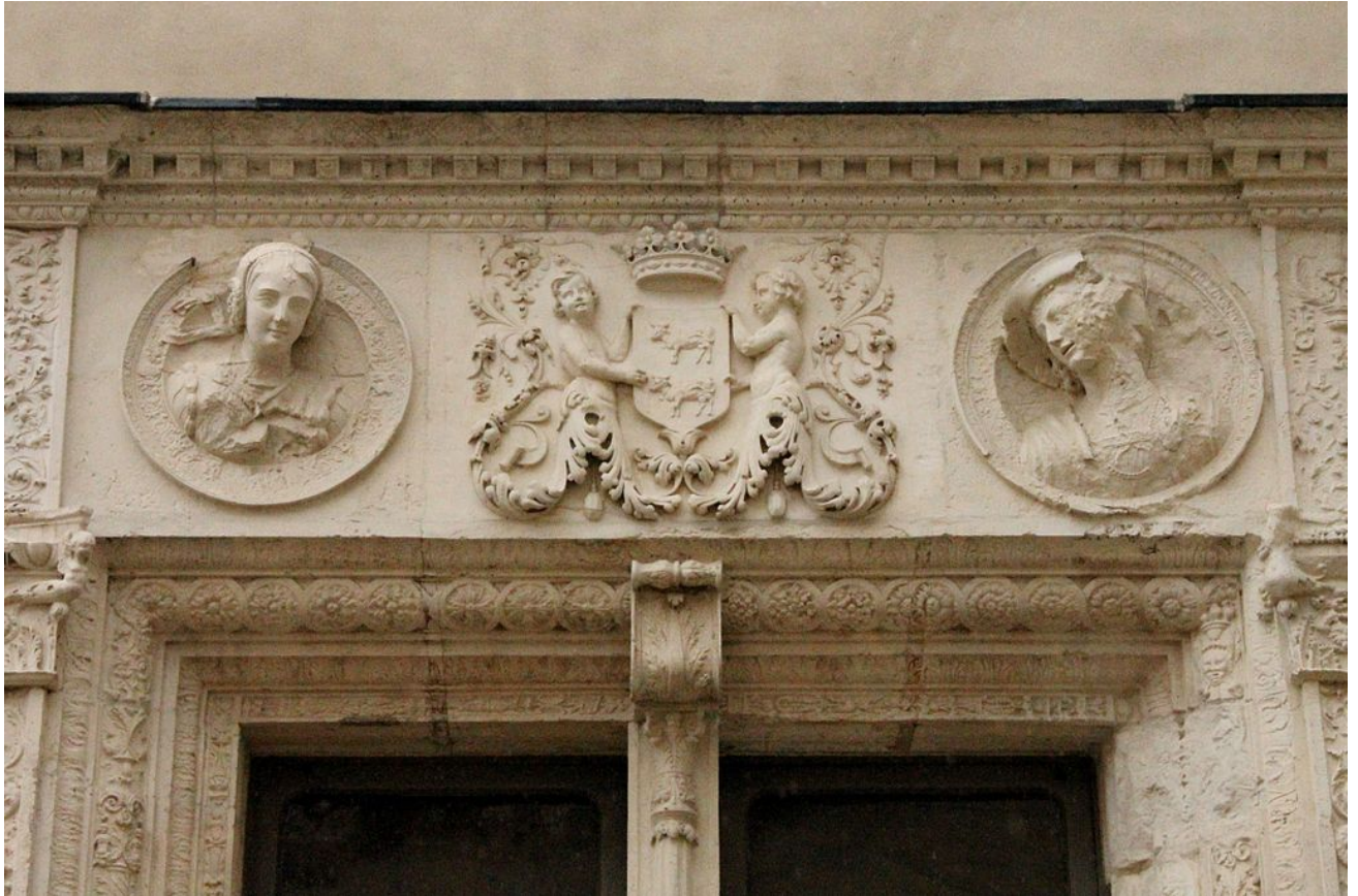
Герб Беарна на замке в По