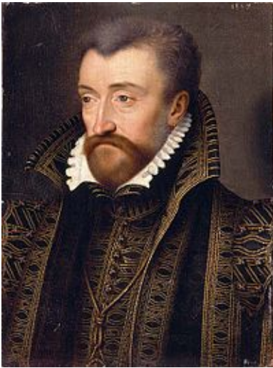
Антуан де Бурбон, герцог Вандомский

Вскоре распутный французский двор вновь получил обильную пищу для сплетен: «Подумать только, этот ветреный любимец женщин верен своей тощей наваррской козе. Да еще и прилюдно демонстрирует свои чувства».