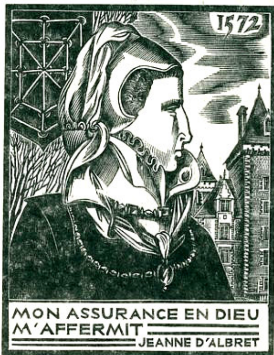
Королева Жанна открыто поддерживала гугенотов

Мадам не зря прошла суровую школу в родной Флоренции: покойный автор «Государя» Никколо Макиавелли наверняка обрадовался бы, видя, сколь способную ученицу он приобрел. По обыкновению выждав, пока ситуация сама придет к какому-либо завершению, Екатерина в нужный момент незаметно внесла несколько корректив и... Вскоре Антуан по уши влюбился в ее фрейлину Луизу де Лимоьер, строго проинструктированную королевой, и позабыл о своих былых притязаниях на регентство, согласившись на скромную роль наместника. Более того, он решил перейти в католичество. Так протестанты лишились одного из своих вождей. Еще несколькими точными ходами она обезоружила принца Конде и клан Гизов. На очереди оставались адмирал Колиньи и королева Наваррская со своим сыном.