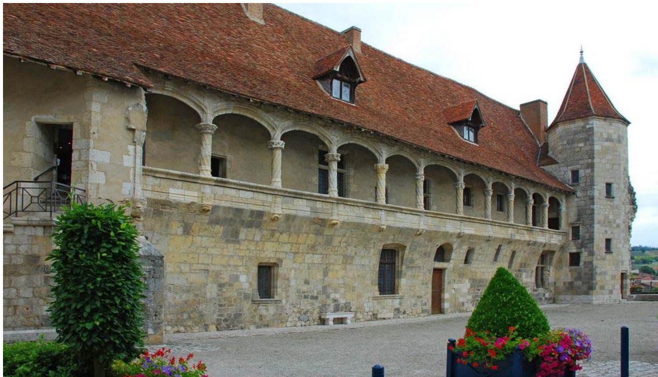
Приют гуманистов – замок в Нераке

И она превратила свои замки в По, Нераке в настоящую цитадель изящных искусств. Сюда, в Нерак, к блестящему наваррскому двору, периодически наезжали знаменитые художники, философы, писатели. А некоторые из них, - Клеман Маро, Пьер Ронсар, Гийом Бриссоне – подолгу жили в окружении щедрой, веселой и остроумной королевы.