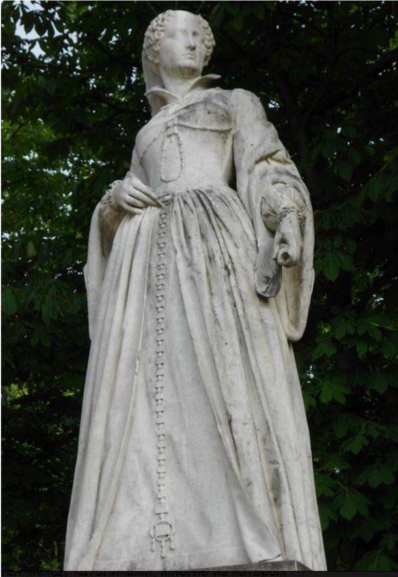
Париж. Статуя королевы Жанны Наваррской в Люксембургском саду

Поддаваться скорби означало проявить слабость, а за ней стояли Наварра и правое дело протестантов. Во имя исполнения этой высокой миссии предстояло бороться, а также растить сына, будущего короля Франции. Будучи католичкой, как и отец, после его смерти она во всеуслышание объявила о принятии протестантской веры, стараясь жить по правде и совести. Но поступать праведно удавалось не всегда - сердце ее ожесточилось. Чтобы раздобыть средства, необходимые деверю Конде, оставшемуся верным гугенотам, королева подвергла разграблению соборы и монастыри провинции Гиень, губернатором