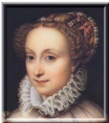
Юная Жанна д' Альбре

вдыхая волшебный аромат лесов и полей. Король Наварры, будучи правоверным католиком, тем не менее, смотрел на новые веяния сквозь пальцы. В конце концов, какая разница, что за веру исповедуют его подданные. Главное, чтобы королева рожала детей, а все остальные исправно возделывали землю и платили налоги. В такой пасторальной атмосфере, на лоне чудесной природы, в 1528 году на свет появилась маленькая Жанна д'Альбре. Едва девчушка вышла из нежного возраста, как тут же потребовала себе лошадь и целыми днями бесстрашно носилась по окрестным холмам вместе с ровесниками-дворянами, явно отдавая предпочтение сильному полу. «Ай да сорвиголова, вся в меня!» – довольно цокал языком старый король, наблюдая за проделками чересчур самостоятельной принцессы.