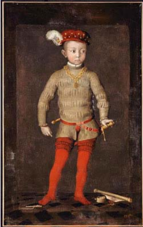
Будущий Генрих IV в детстве

Самое странное заключалось в том, что Жанна, едва взглянув на новорожденного, преисполнилась уверенности, что он воссядет на трон Франции. И воспитывала его соответственно. Хотя реальность не давала к тому никаких оснований: у кузена Генриха и Екатерины Медичи было четверо детей. Однако, ее интуитивная догадка подтвердилась. Впоследствии сын, такой же отменный воин-повеса как отец и дед, стал одним из самых любимых французских королей. Он искренне заботился о благе подданных, мечтая, чтобы у каждой семьи в его государстве по воскресеньям в котелке варилась курица.