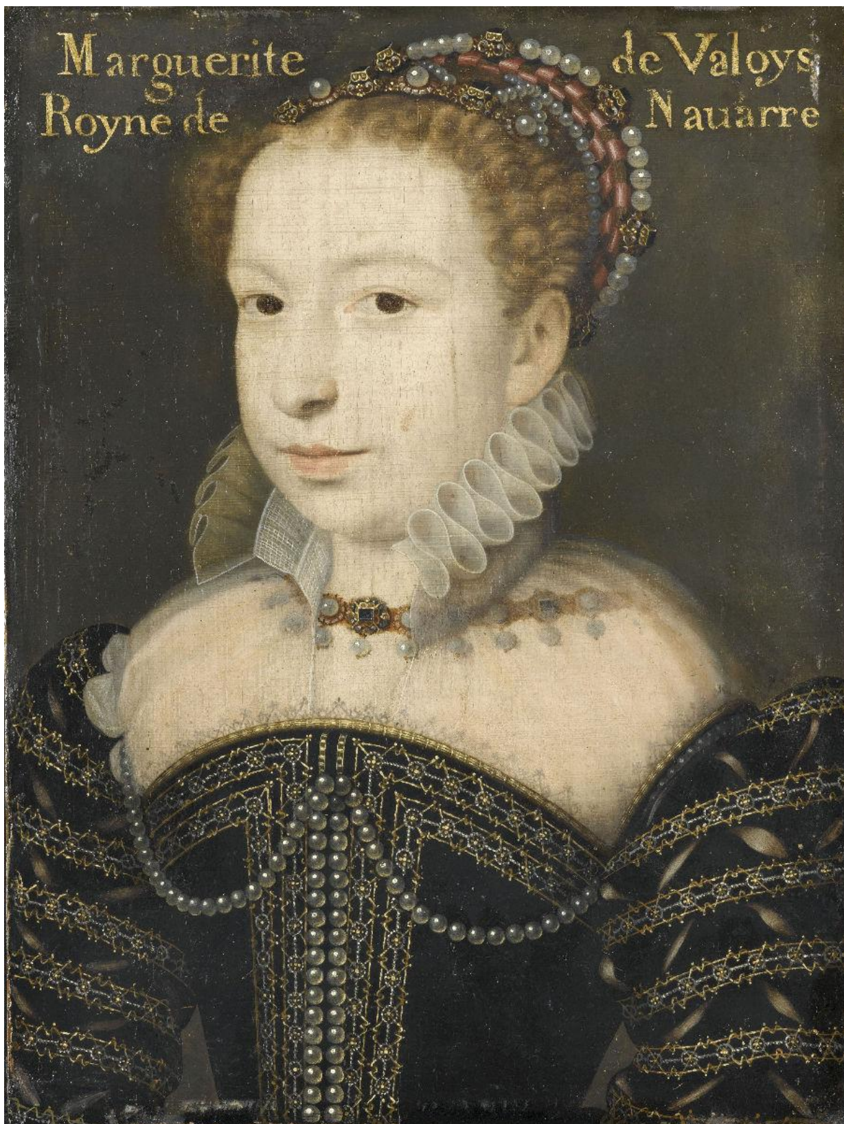
Маргарита Валуа, первая супруга Генриха Наваррского, более известная как королева Марго