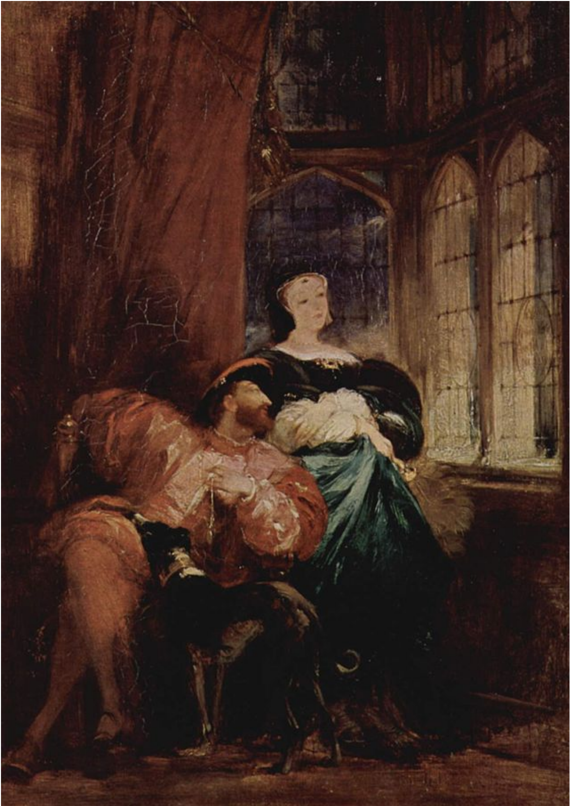
Ричард Паркс Бонингтон. Король Франциск I и его сестра Маргарита, по первому браку герцогиня Ангулемская, в Шамборе